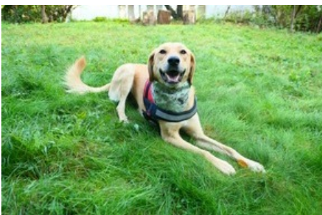
Die kleinen Spinnentiere stechen unbemerkt in arglose Hunde und Katzen, um deren Blut zu saugen.

Diese Meldung kann unter https://www.presseportal.ch/de/pm/100004691/100887860 abgerufen werden.