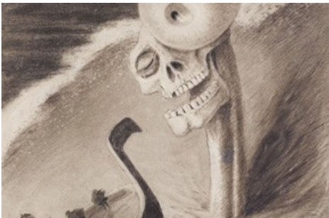
BILD zu OTS - Ausstellung "Alfred Kubin. Bekenntnisse einer gequälten Seele" im Leopold Museum: ALFRED KUBIN 1877-1959, Das Grausen, um 1902, Leopold Museum, Wien