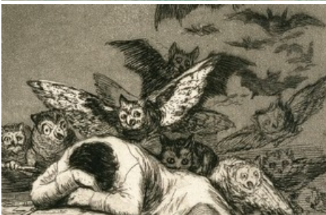
BILD zu OTS - Ausstellung "Alfred Kubin. Bekenntnisse einer gequälten Seele" im Leopold Museum: FRANCISCO DE GOYA 1746-1828, Der Schlaf der Vernunft gebiert Ungeheuer (Blatt 43/80), aus dem Zyklus Los Caprichos, um 1799, OÖ Landes-Kultur GmbH, Land Oberösterreich