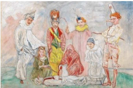
BILD zu OTS - Ausstellung "Alfred Kubin. Bekenntnisse einer gequälten Seele" im Leopold Museum: JAMES ENSOR 1860-1949, Baptême de masques [Die Taufe der Masken], 1925-1930, Privatsammlung