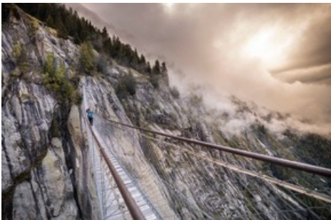
Der neue Stoneman Glaciara Hike - ein exklusives Abenteuer für Wanderer und Trailrunner. Hier: Hängebrücke Aspi-Titter zwischen Bellwald und dem Fieschertal.