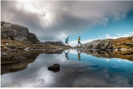
Der neue Stoneman Glaciara Hike - ein exklusives Abenteuer für Wanderer und Trailrunner. Hier: beim Tällisee