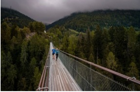
Der neue Stoneman Glaciara Hike - ein exklusives Abenteuer für Wanderer und Trailrunner. Hier: auf der Hängebrücke Gomsbridge zwischen Mühlebach und Fürgangen. Hoch über der jungen Rhone

Diese Meldung kann unter https://www.presseportal.ch/de/pm/100070233/100888095 abgerufen werden.