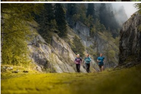
Der neue Stoneman Glaciara Hike ist eine märchenhafte Lauf- und Wanderstrecke.