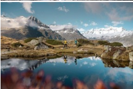
Der neue Stoneman Glaciara Hike - ein exklusives Abenteuer für Wanderer und Trailrunner. Hier: bei der Moosfluh hoch über dem Grossen Aletschgletscher.