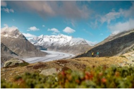
Der neue Stoneman Glaciara Hike - ein exklusives Abenteuer für Wanderer und Trailrunner. Hier: bei der Moosfluh hoch über dem Grossen Aletschgletscher.