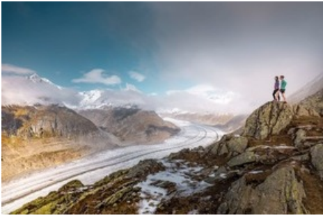
Der neue Stoneman Glaciara Hike - ein exklusives Abenteuer für Wanderer und Trailrunner. Hier: hoch über dem Grossen Aletschgletscher, dem grössten Gletscher der Alpen.