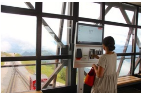
BILD zu OTS - Der neue Ticketautomat Axess TICKET FRAME 600 an der Schafbergbahn in St. Wolfgang.