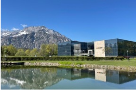
BILD zu OTS - Axess AG Headquarters in Anif/Salzburg

Diese Meldung kann unter https://www.presseportal.ch/de/pm/100068245/100888494 abgerufen werden.