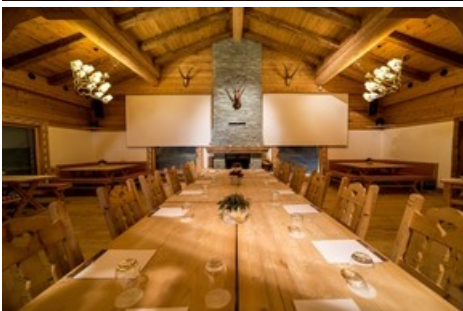
Charmantes Ambiente für konstruktive Meetings im Madrisa-Hof

Diese Meldung kann unter https://www.presseportal.ch/de/pm/100077643/100888610 abgerufen werden.