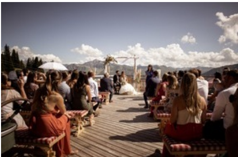
Freie Trauung im Madrisa-Hof