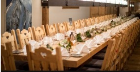
Nominationsbanner – einzigartige Atmosphäre im Hirschkeller