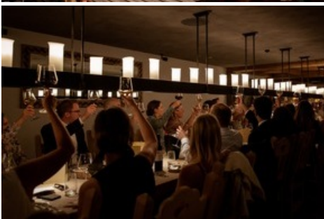
Gesellige Momente im Madrisa-Hof