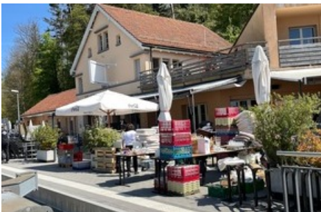
Alles wurde ausgeräumt um Platz für die Renovierungen und Umbauten zu machen.