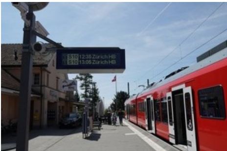
Das Gmütliberg wird zum Hillz - Das frische, neue Trend-Restaurant direkt an der Bahnhofstation Uetliberg.