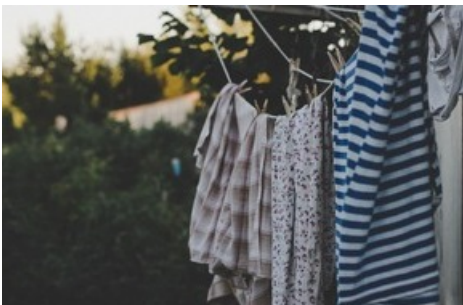
Nachhaltigkeit in der Waschmittelindustrie: So kommuniziert das Schweizer Start-up bluuwash