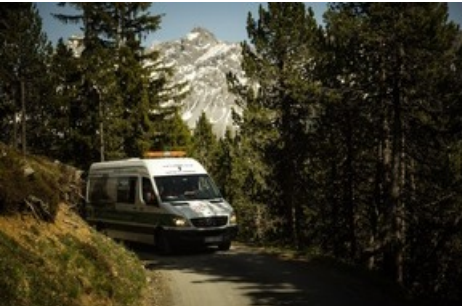
Nach rund drei Tagen Transport sind die beiden Bären wohlbehalten im Bündner Bärenschutzzentrum angekommen.