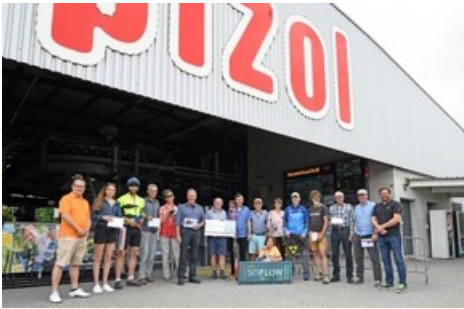
Wettbewerb Pizol Champion 21/22