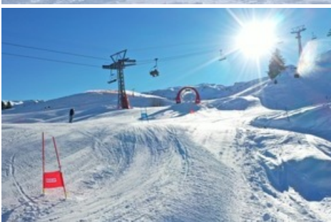
Brack.ch Skimovie am Pizol

Diese Meldung kann unter https://www.presseportal.ch/de/pm/100085818/100889633 abgerufen werden.