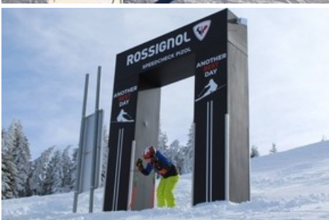
Rossignol Speedcheck am Pizol