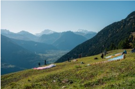
Gleitschirmfliegen in der Aletsch Arena

Diese Meldung kann unter https://www.presseportal.ch/de/pm/100070233/100889722 abgerufen werden.