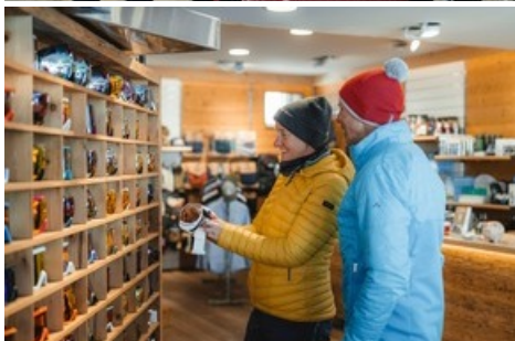
Sportgeschäfte in der Aletsch Arena