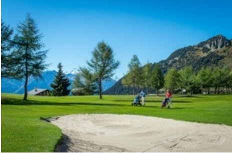
Golfen in der Aletsch Arena