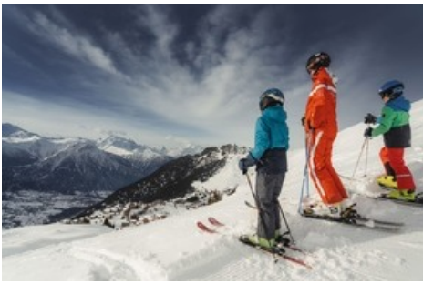
Ski- und Snowboardschulen sind ebenfalls ein wichtiger Bestandteil des Gewerbes der Aletsch Arena