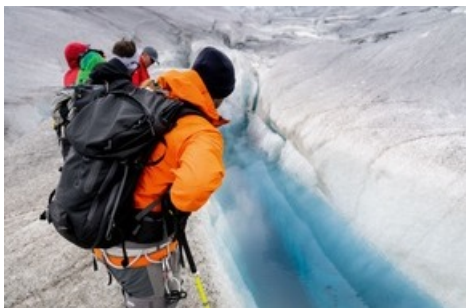
Auf Gletschertour mit den Bergführern in der Aletsch Arena