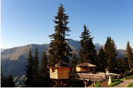
Baumhütten auf der Madrisa