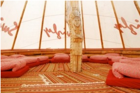
Zipi-Zelt auf der Madrisa

Diese Meldung kann unter https://www.presseportal.ch/de/pm/100077643/100889899 abgerufen werden.