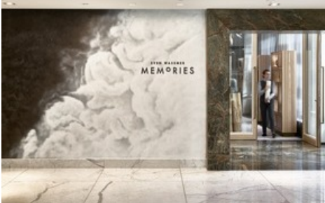
(Innenbereich Restaurant Memories)