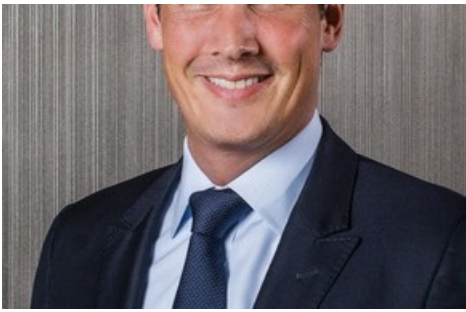
Photo Credit: Grand Resort Bad Ragaz (Marco R. Zanolari, General Manager Grand Hotels)

Diese Meldung kann unter https://www.presseportal.ch/de/pm/100055636/100889916 abgerufen werden.