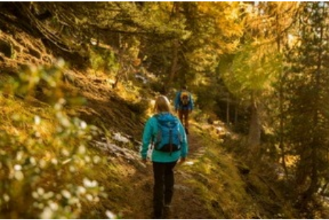
Im Herbst erstrahlt der Aletschwald in den schönsten Farben