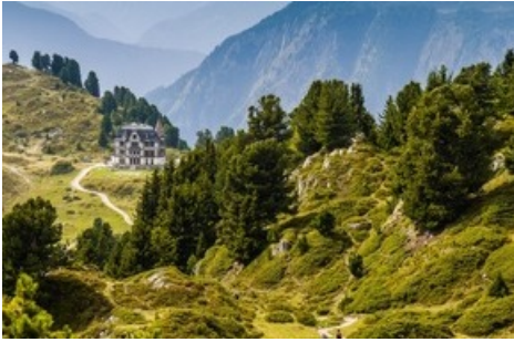
Die Villa Cassel/Pro Natura Zentrum liegt unmittelbar beim Aletschwald