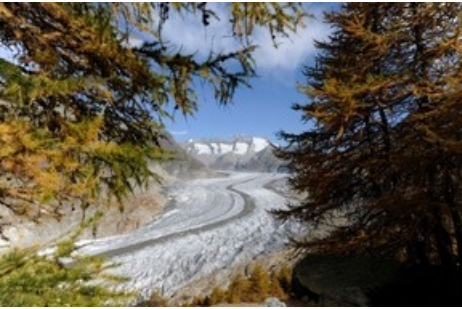
Der Aletschwald mit seinen über 1000-jährigen Arven am Aletschgletscher