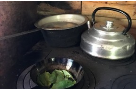
Herstellung von Entgiftungschips