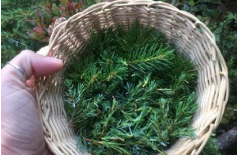
Tannenspitzen aus den Wäldern der Aletsch Arena

Diese Meldung kann unter https://www.presseportal.ch/de/pm/100070233/100890560 abgerufen werden.