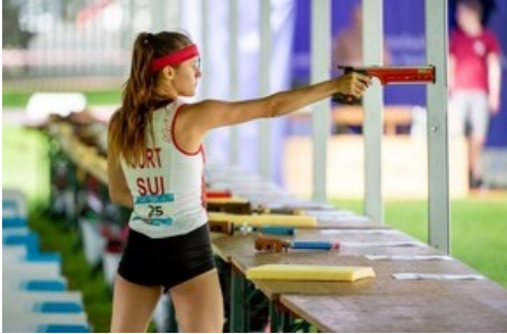
Die Disziplin Laser-Run, eine Kombination mit Schiessen (Laserpistolen) und Laufen, ist der Höhepunkt und beschliesst am 3. Juli (15 - 18 Uhr) den Wettkampf.

Diese Meldung kann unter https://www.presseportal.ch/de/pm/100052433/100891281 abgerufen werden.