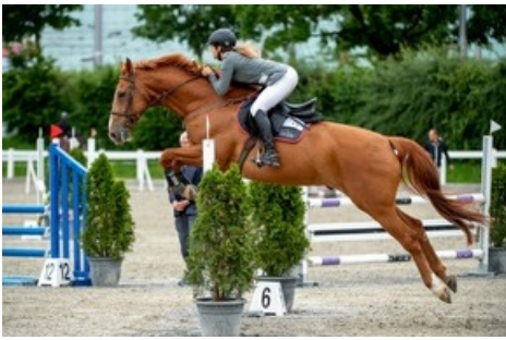
Die Disziplin Reiten findet am Freitag (Vorreiten) und Samstag beim Nationalen Pferdesportzentrum in Bern statt.