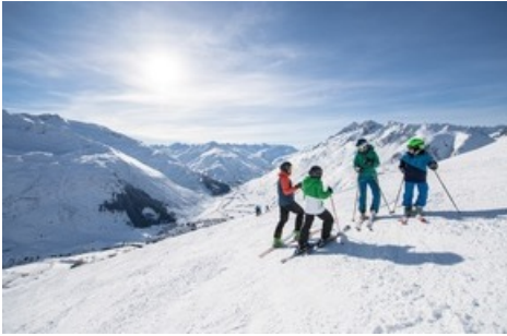
Perfekte Bedingunge in Andermatt+Sedrun+Disentis