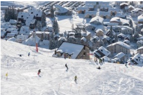
Abfahrt am Nätschen in Andermatt+Sedrun+Disentis