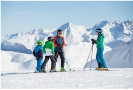
Schneespass in Andermatt+Sedrun+Disentis