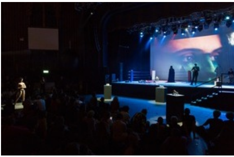
Grace Schwindt, The Boxer , 2018, Performance, 50 min., Kentish Town Forum, David Robert Arts Foundation, London