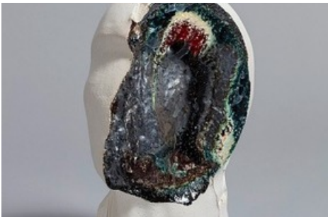
Grace Schwindt, In Between Touch , 2022, Courtesy die Künstlerin und Zeno X Gallery, Antwerpen