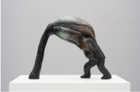
Grace Schwindt, Man and Flower , 2019, Bronze, 22,5 × 29,5 × 8 cm, Courtesy die Künstlerin und Zeno X Gallery, Antwerpen

Diese Meldung kann unter https://www.presseportal.ch/de/pm/100059306/100892712 abgerufen werden.