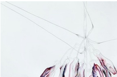
Grace Schwindt, Fritillaria Imperialis , 2020, Aquarell und Bleistift auf Papier, 61 × 46 cm, Courtesy die Künstlerin und Zeno X Gallery, Antwerpen