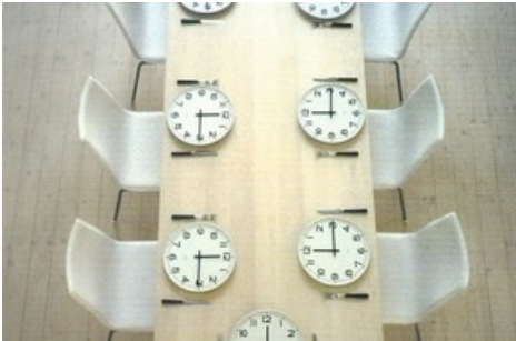
Roman Signer, Tisch, 2002, Foto: Barbara Signer, © Roman Signer