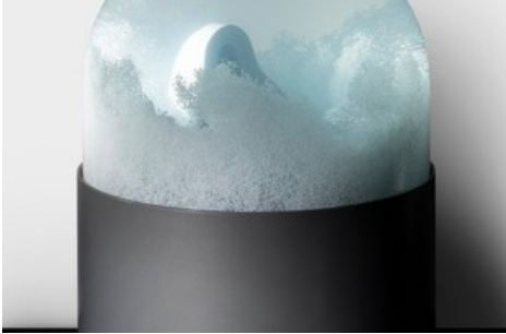
Bethan Huws, Reason (or Winter), 2018