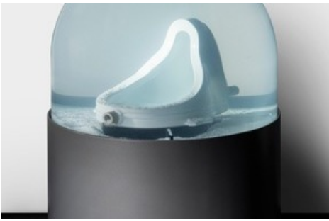
Bethan Huws, Reason (or Winter), 2018