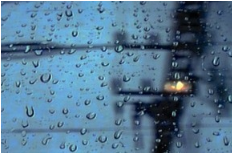
Aleksandra Signer, (Train) grande vitesse, 1995, © Aleksandra Signer