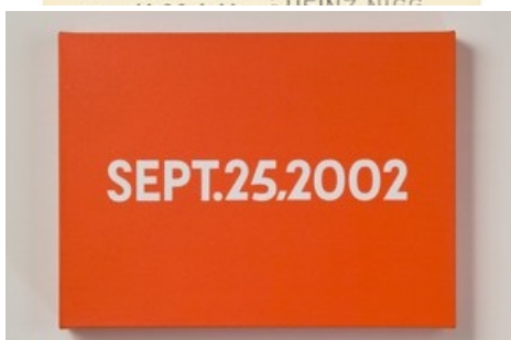
On Kawara, SEPT. 25, 2002 , Kunstmuseum St.Gallen