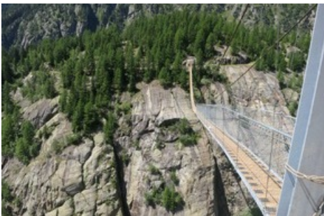
Hängebrücke Aspi-Titter im Fieschertal