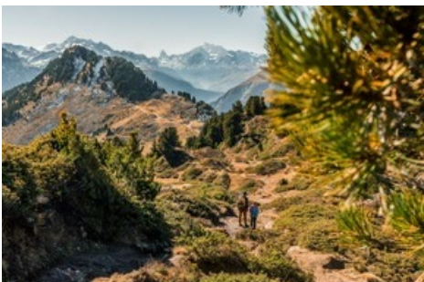
Herbstwandern auf der Riederfurka zur Villa Cassel