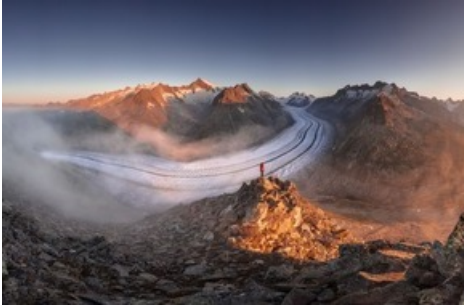
Sonnenaufgang auf dem Eggishorn