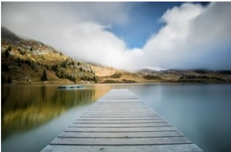
Badesteg auf dem Bettmersee

Diese Meldung kann unter https://www.presseportal.ch/de/pm/100070233/100894694 abgerufen werden.