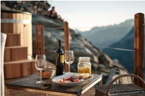
Genuss im Aletsch Cube auf dem Eggishorn