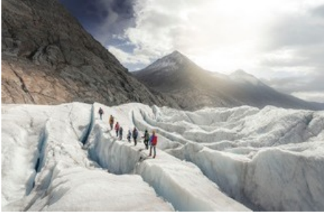
Gletschertour auf dem Grossen Aletschgletscher