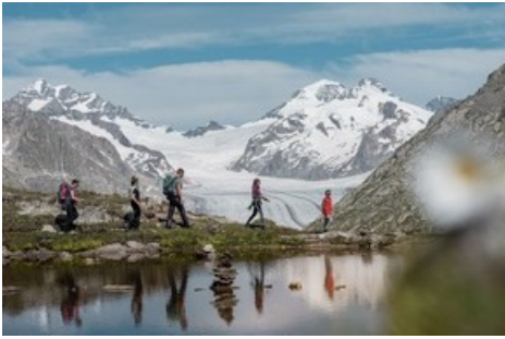
Wandern vor dem Aletschgletscher