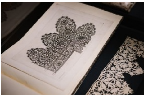
Musterzeichnung und Spitze in der Ausstellung "Threads of Power. Lace from the Textilmuseum St. Gallen" am Bard Graduate Center New York