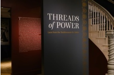
Einblick in die Ausstellung "Threads of Power. Lace from the Textilmuseum St. Gallen" am Bard Graduate Center New York