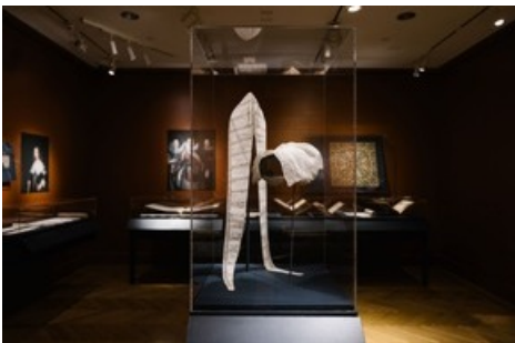
Ausstellungsansicht "Threads of Power. Lace from the Textilmuseum St. Gallen" am Bard Graduate Center New York