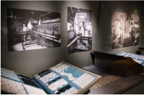
Musterbücher für Spitzen in der Ausstellung "Threads of Power. Lace from the Textilmuseum St. Gallen" am Bard Graduate Center New York