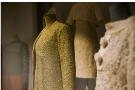
Kleid getragen von Michelle Obama anlässlich der ersten Amtseinführung ihres Mannes, Designerin Isabel Toledo, Spitzenstoff von Forster Rohner AG, ausgestellt in "Threads of Power. Lace from the Textilmuseum St. Gallen" am Bard Graduate Center New York