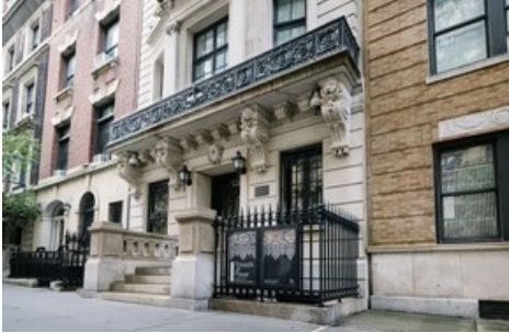
Aussenaufnahme Bard Graduate Center New York / Foto: Da Ping Luo

Diese Meldung kann unter https://www.presseportal.ch/de/pm/100053499/100894924 abgerufen werden.