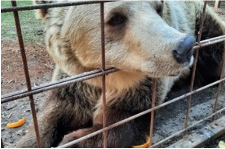
L'ourse Iva a passé toute sa vie dans un petit enclos inadapté.