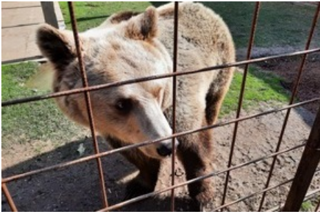
L'ourse Iva a passé toute sa vie dans un petit enclos inadapté.