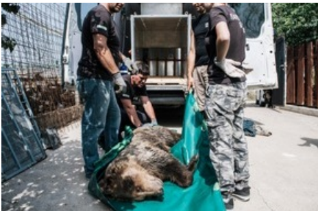
QUATRE PATTES transfère une ourse sauvée de Macédoine du Nord en Bulgarie.