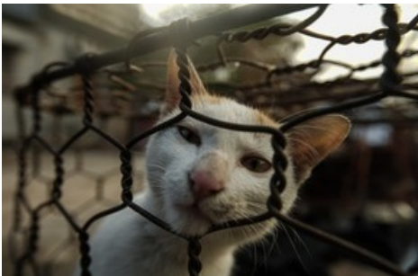
Eine von VIER PFOTEN gerettete Katze in Vietnam.