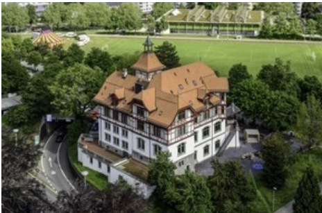
Militärkantine St. Gallen