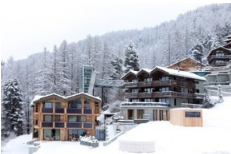
CERVO Mountain Resort Zermatt

Diese Meldung kann unter https://www.presseportal.ch/de/pm/100088995/100895781 abgerufen werden.