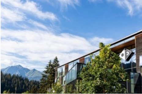
Riders Hotel Laax