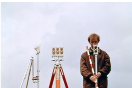
Werbefoto für die Zielpunkteempfänger RD 10 und 20.

Diese Meldung kann unter https://www.presseportal.ch/de/pm/100085663/100896251 abgerufen werden.