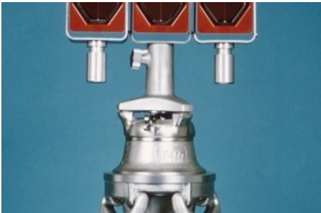
Reflektoren für den Distanzmesser DM 500 von Kern