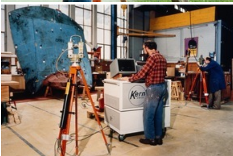
Industrievermessung in den 1980er-Jahren.