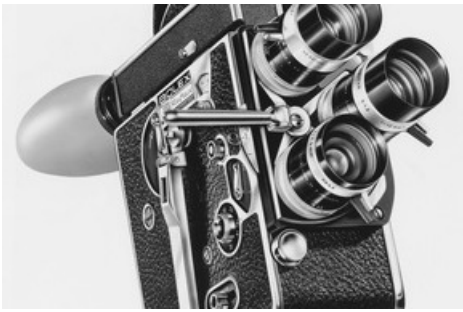
Bolex-Kamera mit Switar-Objektiven von Kern, 1950er-Jahre (Stadtmuseum Aarau, Sammlung Kern).