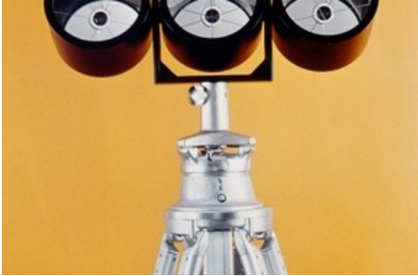
Reflektor zu den elektro-optischen Distanzmesser DM