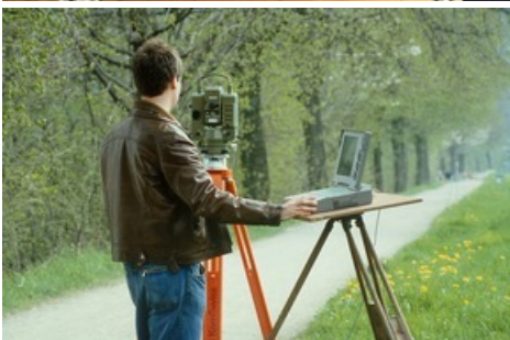
Totalstation mit Theodolit E 2 und Distanzmesser DM 504 mit verbundenem Laptop zur Datenverarbeitung, Ende der 1980er-Jahre.