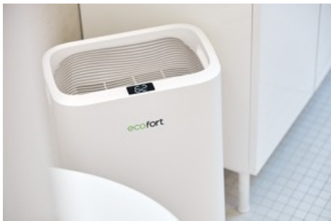
Der Luftentfeuchter ecoQ 20L Energy Saver