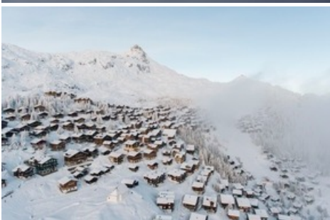
Verschneites Dorfbild Bettmeralp