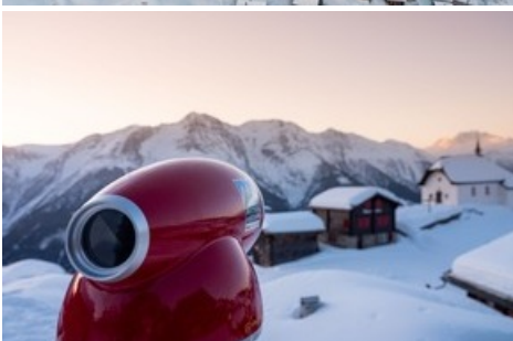
Kapelle Maria zum Schnee auf der Bettmeralp