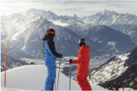
Skifahren mit Sicht aufs Matterhorn