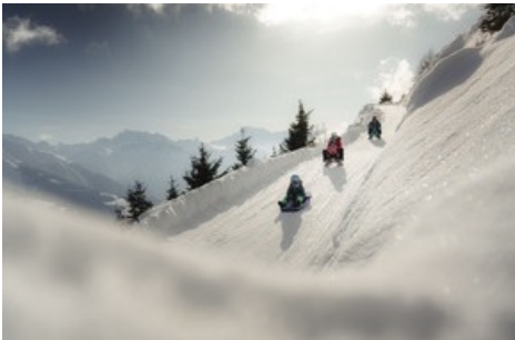
Schlitteln auf der Fiescheralp