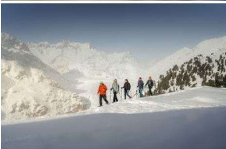
Schneeschuhlaufen vor dem Grossen Aletschgletscher