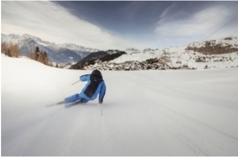
Skifahren mit Sicht auf über 40 Viertausender in der Aletsch Arena

Diese Meldung kann unter https://www.presseportal.ch/de/pm/100070233/100896860 abgerufen werden.