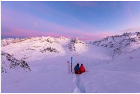
Sonnenaufgang auf dem Eggishorn