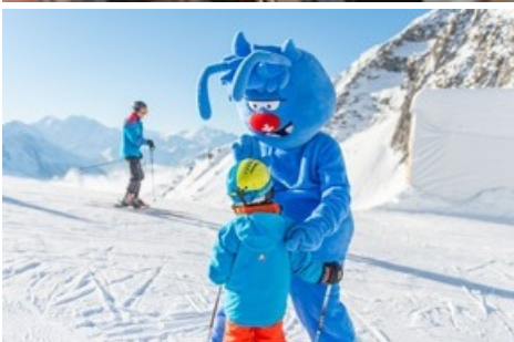
Skifahren mit Gletschi in der Aletsch Arena