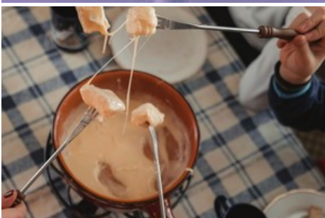
Fondue in der Fonduegondel geniessen