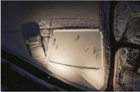
Schlittschuhlaufen auf der neuen Eisbahn im Fieschertal