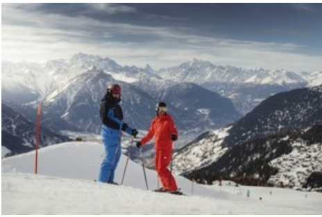
Skifahren mit Sicht auf das Matterhorn und 40 Viertausender