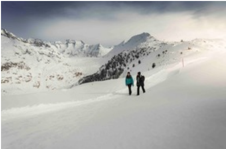
Winterwandern in der Aletsch Arena