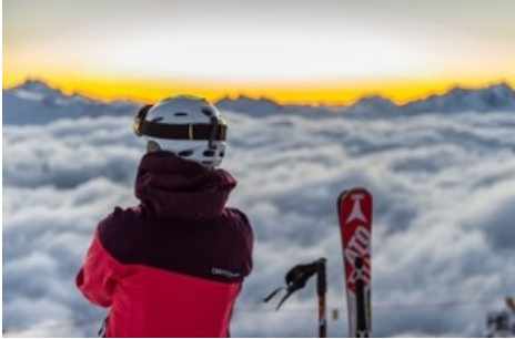
Sonnenaufgang in der Aletsch Arena