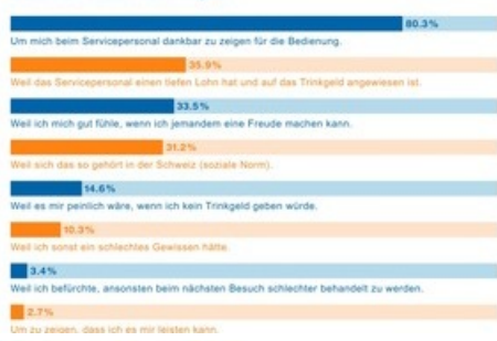
Gründe zum Geben von Trinkgeld