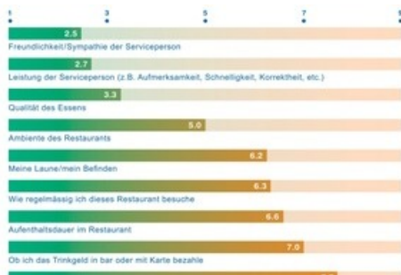
Wichtige Faktoren zur Bestimmung der Höhe des Trinkgelds

Diese Meldung kann unter https://www.presseportal.ch/de/pm/100018827/100897762 abgerufen werden.