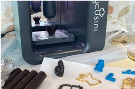
Schoggi-Kreationen aus dem 3D-Drucker: Selber gestalten und ausdrucken!