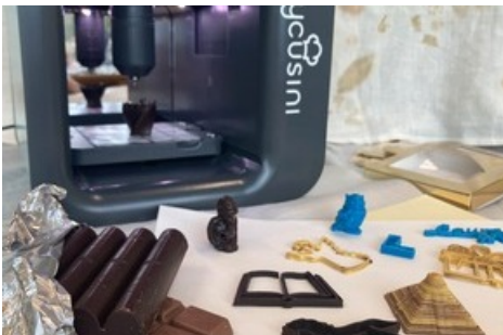
Schoggi-Kreationen aus dem 3D-Drucker: Selber gestalten und ausdrucken!

Diese Meldung kann unter https://www.presseportal.ch/de/pm/100085663/100897959 abgerufen werden.