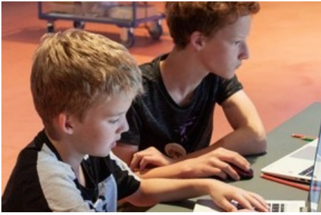
Weihnachtsmotive am Computer designen und dreidimensional ausdrucken.