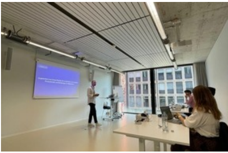
Metaverse Einführungskurs in kleinen Gruppen