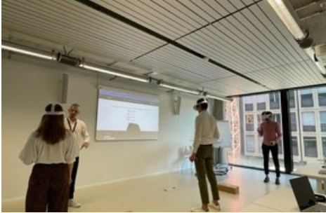
Metaverse Kurse in Zürich

Diese Meldung kann unter https://www.presseportal.ch/de/pm/100004069/100897969 abgerufen werden.