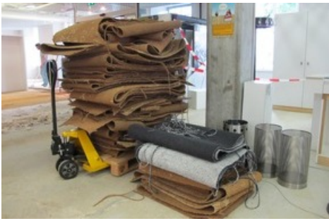
Der Teppich im Erdgeschoss des Naturmuseums muss ersetzt werden.