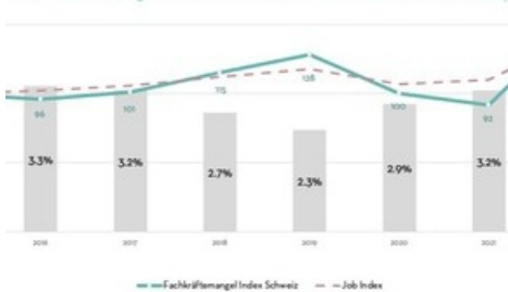
Fachkräftemangel Index Schweiz, Job Index und Arbeitslosenquote