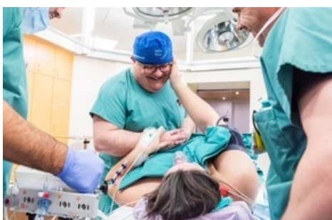
Platz 1 beim PR-Bild Award 2022 in der Kategorie Storys & Kampagnen und PR-Bild des Jahres Schweiz: "Danke im OP-Saal!", eingereicht von Universitäts-Kinderspital Zürich. Honorarfreie Nutzung dieses Fotos nur in Zusammenhang mit Berichterstattung zum PR-Bild Award. / Weiterer Text über ots und www.presseportal.ch/de/nr/100000003 / Die Verwendung dieses Bildes ist für redaktionelle Zwecke honorarfrei.