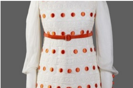
Grand Prix Kleid von Paola Felix, 1969, AKRIS. Guter Stoff. Kollektion Textilmuseum Permanente Ausstellung des Textilmuseums, ab 12.5.2023