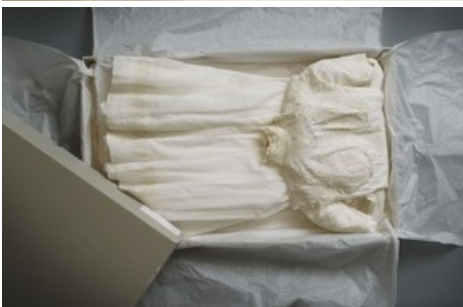
Damenkleid mit Stickereien, 1900-1910. "100 Shades of White. Eine Farbe in Mode", Eine Ausstellung im Textilmuseum St.Gallen, 3.3.-10.9.2023