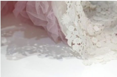
"100 Shades of White. Eine Farbe in Mode", Textilmuseum St. Gallen 3. März bis 10. September