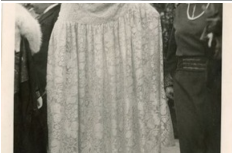
Modelfotografie einer Frau in einem weissen Cape mit Stickerei sowie bestickten Schuhen aus den 1920er Jahren. "100 Shades of White. Eine Farbe in Mode", Eine Ausstellung im Textilmuseum St.Gallen, 3.3.-10.9.2023