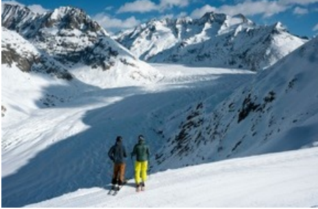
Grosser Aletschglacier im Winter