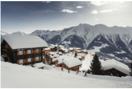
Winter auf der Riederalp in der Aletsch Arena

Diese Meldung kann unter https://www.presseportal.ch/de/pm/100070233/100899621 abgerufen werden.