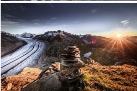
Grosser Aletschglacier