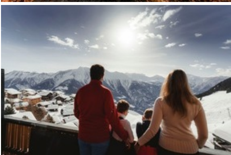
Winter auf der Riederalp in der Aletsch Arena