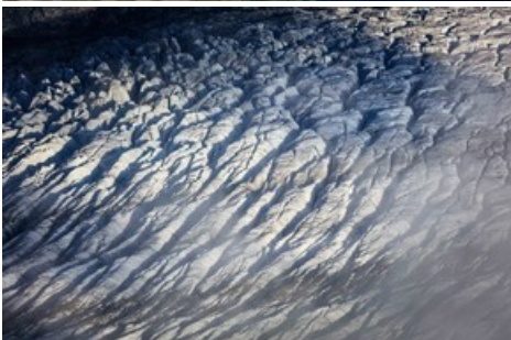
Grosser Aletschglacier