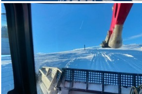
Pistenpräparierung mit Winde / Pizolbahnen AG