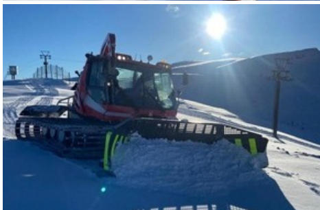
Pistenbearbeitung am Pizol / Pizolbahnen AG