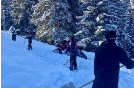
Pizol Mitarbeiter legen Hand an / Pizolbahnen AG

Diese Meldung kann unter https://www.presseportal.ch/de/pm/100085818/100899768 abgerufen werden.