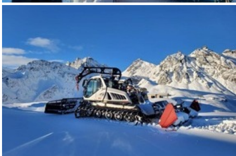
Pistenpräparierung auf 2226 m ü.M.