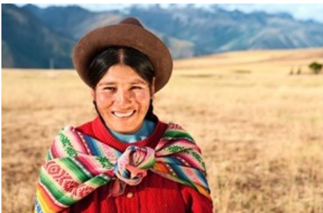
Begegnungen, die verbinden, zeichnen das Reiseerlebnis mit Vögele Reisen auch in Peru mehr denn je aus.