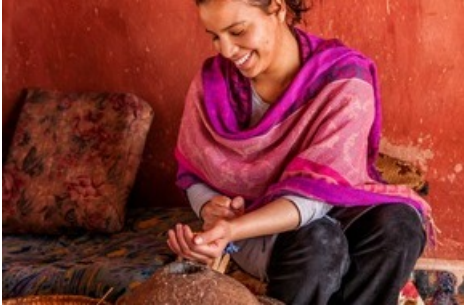
Die Marjana-Genossenschaft stellt Kosmetik und Lebensmittel auf Arganbasis her. Ein Besuch der von Frauen gegründeten Initiative gehört zu den authentischen Erlebnissen der Marokko-Kleingruppenreise.

Diese Meldung kann unter https://www.presseportal.ch/de/pm/100018582/100900196 abgerufen werden.