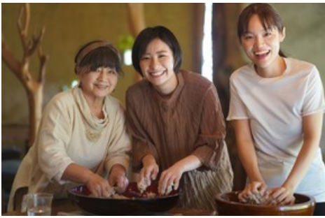
Insider-Erlebnis in Japan: Auf der Rundreise mit Vögele Reisen lernen die Gäste von einheimischen Köchinnen, wie Soba-Nudeln entstehen.