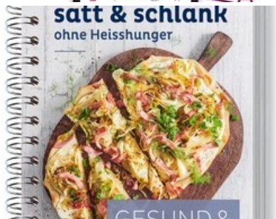
Kochbuch «satt & schlank – ohne Heisshunger»

Diese Meldung kann unter https://www.presseportal.ch/de/pm/100068198/100900694 abgerufen werden.