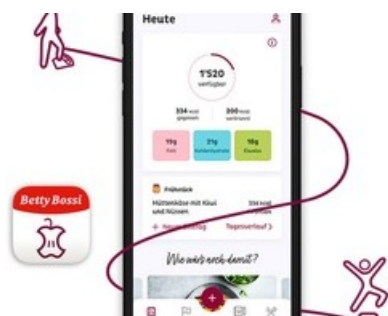
App «Gesund Abnehmen»