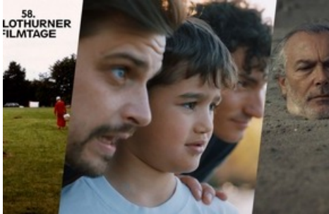
Weiterer Text über ots und www.presseportal.ch/de/nr/100014224 / Die Verwendung dieses Bildes für redaktionelle Zwecke ist unter Beachtung aller mitgeteilten Nutzungsbedingungen zulässig und dann auch honorarfrei. Veröffentlichung ausschließlich mit Bildrechte-Hinweis.

Diese Meldung kann unter https://www.presseportal.ch/de/pm/100014224/100901153 abgerufen werden.