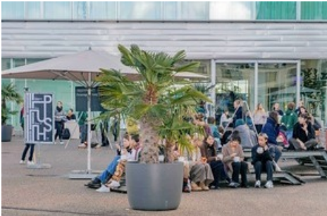
Das Open House 2023 der Hochschule für Gestaltung und Kunst FHNW mit Special für Studieninteressierte