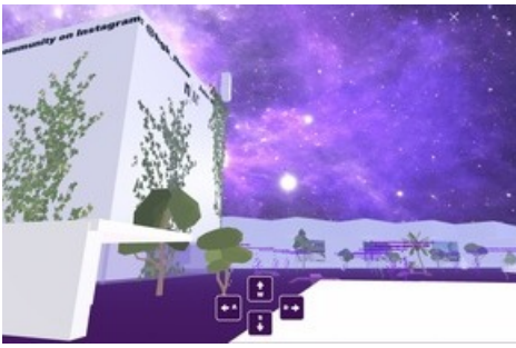
Das Open House 2023 der Hochschule für Gestaltung und Kunst FHNW findet auch online in einem 3D-Space statt.