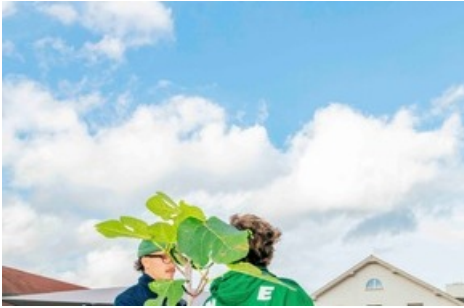
Das Open House 2023 auf dem Campus der Hochschule für Gestaltung und Kunst FHNW