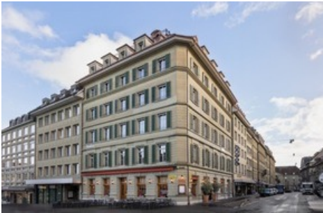
Das neue, alte Haus am Waisenhausplatz nimmt wieder einen wertigen Platz im historischen Berner Stadtbild ein.