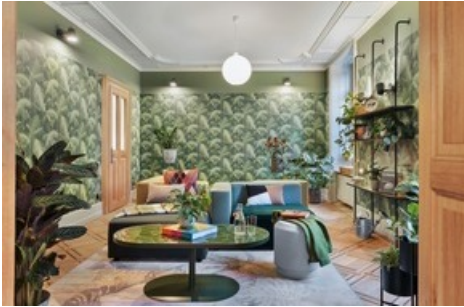
Der Greenroom lädt zum Verweilen ein.