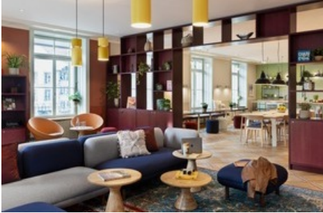
Modern reduzierter und zugleich behaglicher Wohnstil.