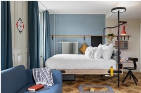
Charakteristisch für die Marke gibt es auch in den Zimmern ein flexibles Element: Dieses sind mit einem speziell designten Bettmodul ausgestattet, das nicht nur einen erholsamen Schlaf garantiert, sondern auch einen Schreibtisch, ausziehbare Ablagen, Leuchten und eine integrierte Hakenleiste umfasst. An dieser können Gäste, neben Kleidern, auch Kissen, den Kofferbock, Taschen, die Laptop- Arbeitsunterlage und vieles mehr aufhängen und somit einfach Platz schaffen.