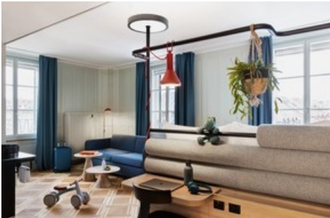
Die Familienzimmer verfügen über eine bequeme Sitzecke mit Sofa.