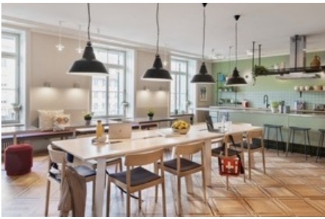
Gemeinschaftsküche und Community Table: gemeinsam kochen und essen wie in der WG.