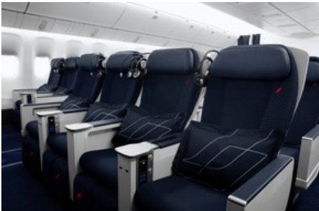
Die neue Premium-Economy-Kabine mit verstellbaren Sitzen.