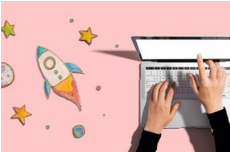
Launch Ship'N'Train Travel