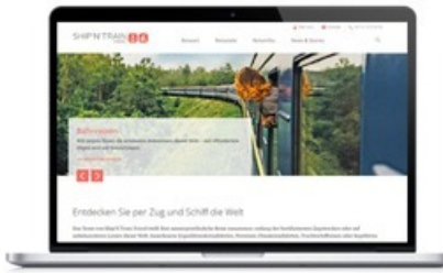
«Ship'N'Train Travel» launcht neuen Digitalauftritt