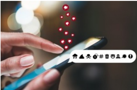
Weiterer Text über ots und www.presseportal.ch/de/nr/100014224 / Die Verwendung dieses Bildes für redaktionelle Zwecke ist unter Beachtung aller mitgeteilten Nutzungsbedingungen zulässig und dann auch honorarfrei. Veröffentlichung ausschließlich mit Bildrechte-Hinweis.

Diese Meldung kann unter https://www.presseportal.ch/de/pm/100014224/100902581 abgerufen werden.