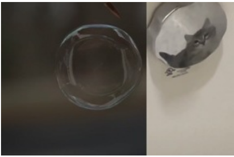
Jijia Zhang, Between the Acts , 2022, Videostill, HD Video, 38'33", 16:9, Farbe, Ton