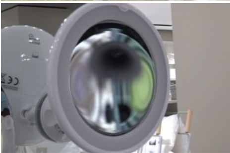
Jijia Zhang, Beautiful Mistakes (after LB), 2022, Videostill, HD Video, 08:58, 16:9, Farbe, Ton