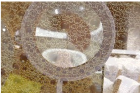
Jijia Zhang, Beautiful Mistakes (after LB), 2022, Videostill, HD Video, 08:58, 16:9, Farbe, Ton, Courtesy die Künstlerin