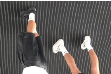
Jijia Zhang, Beautiful Mistakes (after LB), 2022, Videostill, HD Video, 08:58, 16:9, Farbe, Ton