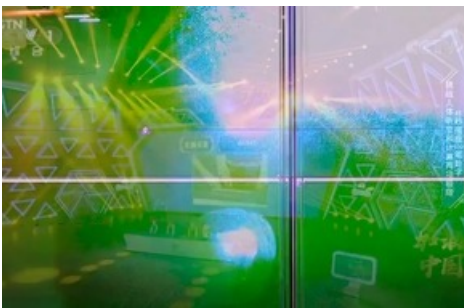
Jijia Zhang, Between the Acts, 2022, Videostill, HD Video, 38'33", 16:9, Farbe, Ton