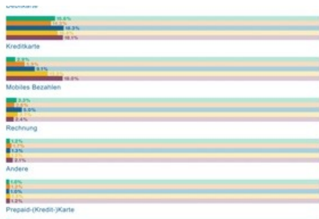
Zahlungsmittel nach Transaktionsanteil gemäss Gesamtmarkt