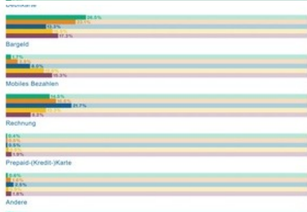
Zahlungsmittel nach Umsatzanteil gemäss Gesamtmarkt

Diese Meldung kann unter https://www.presseportal.ch/de/pm/100018827/100902964 abgerufen werden.