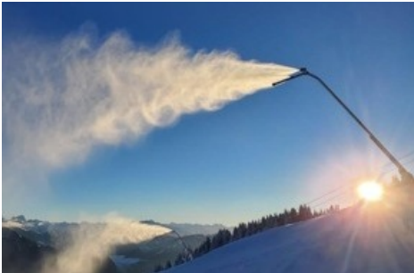
Beschneigung 4.0 Bächler Lanzen 3