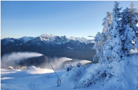
Beschneigung 4.0 Bächler Lanzen 2