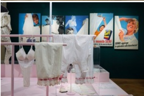
Lingerie gestern und heute Ausstellung «100 Shades of White», Textilmuseum St.Gallen, 3.3.2023-10.9.2023