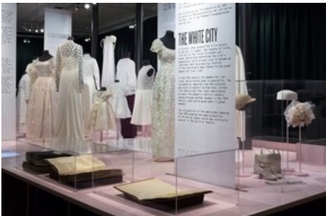
Stickereikleider Ausstellung «100 Shades of White», Textilmuseum St.Gallen, 3.3.2023-10.9.2023

Diese Meldung kann unter https://www.presseportal.ch/de/pm/100053499/100903706 abgerufen werden.