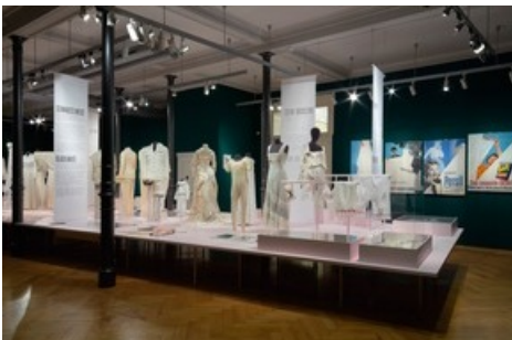
Weiss in Mode – Ausstellungsansicht Ausstellung «100 Shades of White», Textilmuseum St.Gallen, 3.3.2023-10.9.2023