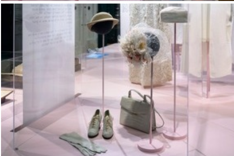
Weisse Accessoires Ausstellung «100 Shades of White», Textilmuseum St.Gallen, 3.3.2023-10.9.2023