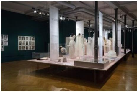
Weiss in Mode – Ausstellungsansicht Ausstellung «100 Shades of White», Textilmuseum St.Gallen, 3.3.2023-10.9.2023