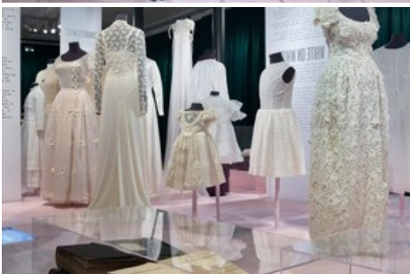
Stickereikleider Ausstellung «100 Shades of White», Textilmuseum St.Gallen, 3.3.2023-10.9.2023