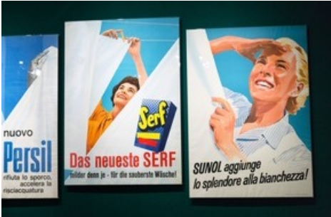
Waschmittelplakate 1940-60er Jahre Ausstellung «100 Shades of White», Textilmuseum St.Gallen, 3.3.2023-10.9.2023