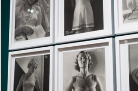
Modelfotografien von Unterwäsche- und Nachwäschemodelle der Firma Hanro (Leihgabe Archäologie und Museum Baselland) Ausstellung «100 Shades of White», Textilmuseum St.Gallen, 3.3.2023-10.9.2023