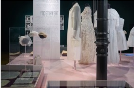
Mode in Weiss Ausstellung «100 Shades of White», Textilmuseum St.Gallen, 3.3.2023-10.9.2023