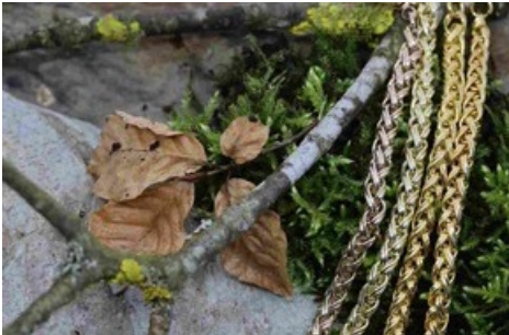
Vergolden lassen in verschiedensten Goldtönen

Diese Meldung kann unter https://www.presseportal.ch/de/pm/100078044/100904251 abgerufen werden.