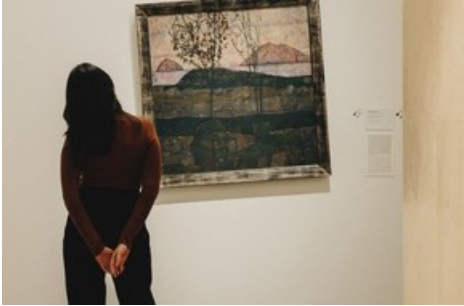
BILD zu OTS - Ausstellungsansicht „A Few Degrees More“. Kuratierte Intervention im Rahmen der Ausstellung „Wien 1900. Aufbruch in die Moderne“ im Leopold Museum; Besucherin vor dem Gemälde Egon Schiele, Versinkende Sonne, 1913

Diese Meldung kann unter https://www.presseportal.ch/de/pm/100015167/100904639 abgerufen werden.