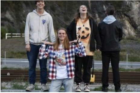
Bliss Pills aus Glarus spielen am Freitag auf der GLKB-Bühne.