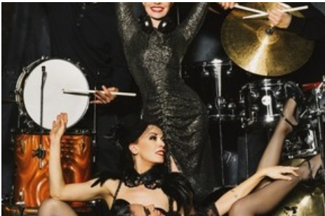
DJ ZsuZsu kommt wieder ans Glarner Stadtopenair – am Freitag nimmt sie Tänzerinnen und Schlagzeuger mit ins glarnerSach Villag.