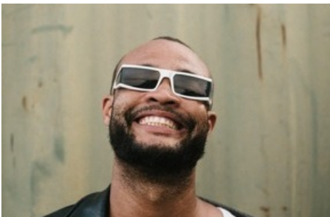
SRF 3 Best Talent Nativ