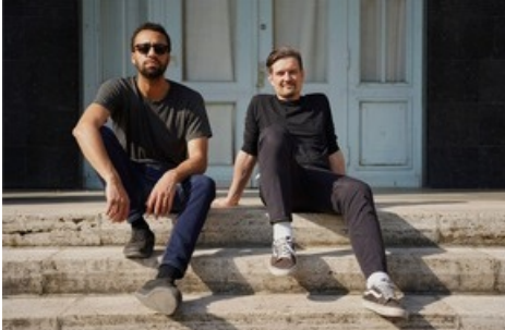
Treptow ist nicht nur ein Berliner Stadtteil, sondern auch eine Berliner Band – die beiden treten am Samstag im glarnerSach Village auf. Bild: Treptow