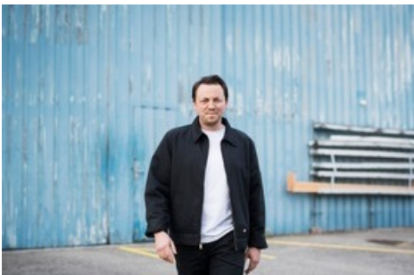
Phenomden (CH) sorgt für einen stimmungsvollen 25. Augustabend auf der GLKB-Bühne.