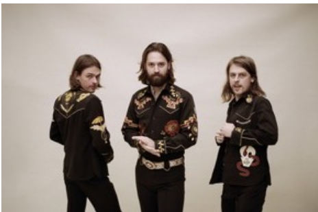
Am 26. August spielen DeWolff (NL) in Glarus ihre explosive Mischung aus elektrifiziertem Südstaaten-Bluesrock mit einer Prise Soul und Psychedelia.