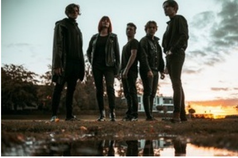
Die BandXOst-Gewinner Unlsh aus St. Gallen spielen am Samstag auf der GLKB-Bühne

Diese Meldung kann unter https://www.presseportal.ch/de/pm/100018582/100904979 abgerufen werden.