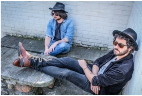
Die Tessiner Make Plain bieten am Samstag im glarnerSach Village Power Folk vom Feinsten.